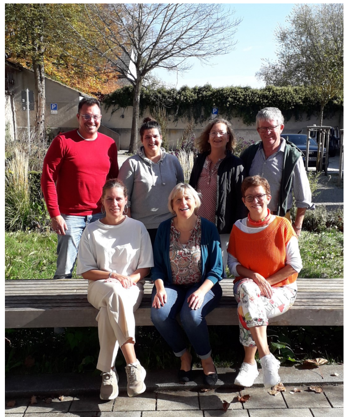
Bild: Multiprofessionelles Team der Heimaufsicht

Landratsamt Weilheim Schongau Heimaufsicht / FQA Münzstraße 48, 86956 Schongau Tel.: 08861 / 211-3182 heimaufsicht@lra-wm.bayern.de