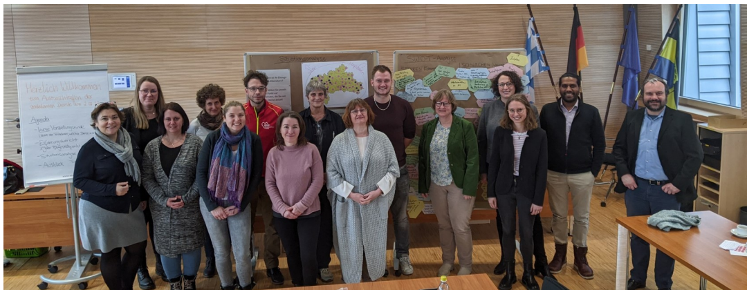
Bild: Austauschtreffen mit den ambulanten Diensten im Landkreis

Im Februar haben wir zum ersten Mal die ambulanten Dienste zu einem Netzwerktreffen eingeladen. Bei einer Abfrage des Pflegestützpunktes Anfang 2022 wurde festgestellt, dass ein Austausch der Dienste untereinander gewünscht ist und sinnvoll wäre um Themen gemeinsam anzugehen. Das erste Treffen wurde gut von den ambulanten Diensten angenommen. Mit Hilfe einer Situationsanalyse, die im Rahmen des Treffens gemacht wurde, konnten erste Themen identifiziert werden. Wir freuen uns auf die weitere Zusammenarbeit.